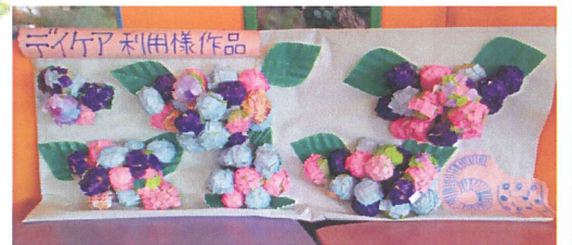
↑ 6月に向けて作った紫陽花の作品です！ 玄関正面に飾ってありますので、お越しの際は是非ご覧ください。